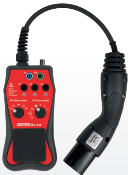
TA 6 (044168)