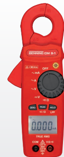
BENNING CM 9-1 (044682)