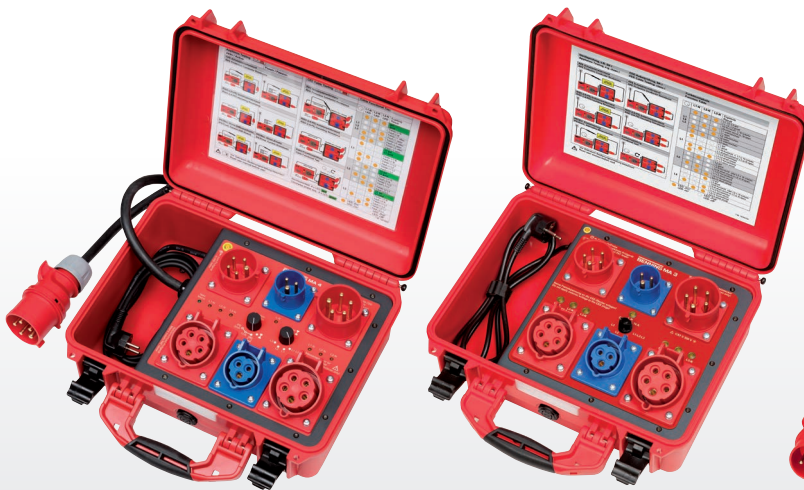
BENNING MA 4 (044162)

Für die Ableit- und Laststrommessung sind Zwischenadapter erforderlich.