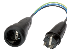
Messadapter (044131) z.B. für CM 9-1