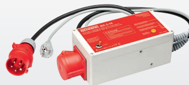
BENNING MA 2-16 (044160)