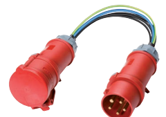
Messadapter (044127/044128) z.B. für CM 9-1